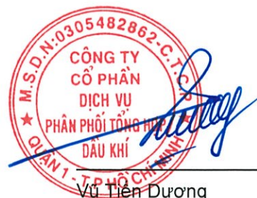
Vũ Tiên Dương Chủ tịch HĐQT Ngày 14 tháng 8 năm 2017

Các thuyết minh từ trang 9 đến trang 36 là một phần cấu thành báo cáo tài chính hợp nhất giữa niên độ này.