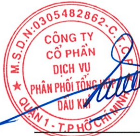
Vũ Tiến Dương Chủ tịch HĐQT

Theo đây, tôi phê chuẩn báo cáo tài chính hợp nhất giữa niên độ đính kèm từ trang 5 đến trang 36. Báo cáo tài chính hợp nhất giữa niên độ này phản ánh trung thực và hợp lý tình hình tài chính hợp nhất của Công ty và công ty con tại ngày 30 tháng 6 năm 2017, cũng như kết quả hoạt động kinh doanh hợp nhất và tình hình lưu chuyển tiền tệ hợp nhất cho kỳ 6 tháng kết thúc vào ngày nêu trên phù hợp với các Chuẩn mực Kế toán Việt Nam, Chế độ Kế toán Doanh nghiệp Việt Nam và các quy định pháp lý có liên quan đến việc lập và trình bày báo cáo tài chính hợp nhất giữa niên độ.