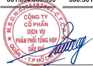
Vũ Tiến Dương Chủ tịch HĐQT Ngày 14 tháng 8 năm 2017

Các thuyết minh từ trang 9 đến trang 36 là một phần cấu thành các báo cáo tài chính hợp nhất giữa niên độ này.